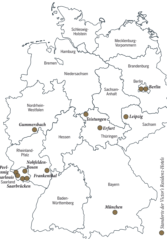
Standorte der Victor's Residenz-Hotels

Für einen Besuch in Victor's Welt gibt es viele gute Gründe. Lassen Sie sich von den Tipps unserer Redaktion inspirieren und planen Sie gleich Ihren nächsten Kurzurlaub bei Victor's!